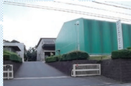
13 リケンケミカルプロダクツ株式会社*