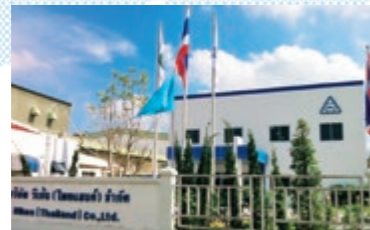
15 RIKEN (THAILAND) CO., LTD. **