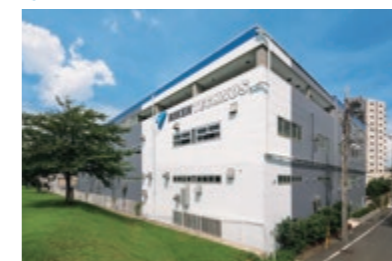
10 研究開発センター(東京)**