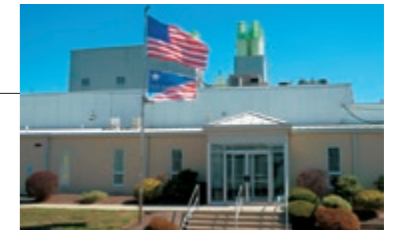
20 RIMTEC CORPORATION*