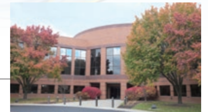
25 RIKEN U.S.A. CORPORATION