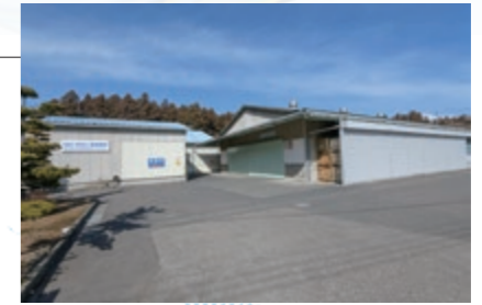
12 株式会社協栄樹脂製作所*