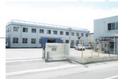
11 リケンケーブルテクノロジー株式会社**