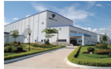
22 RIKEN VIETNAM CO., LTD. **