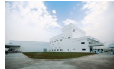
16 RIKEN ELASTOMERS (THAILAND) CO., LTD. **