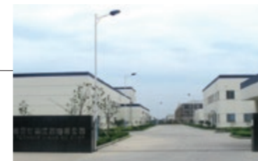
19 理研食品包装(江蘇)有限公司*