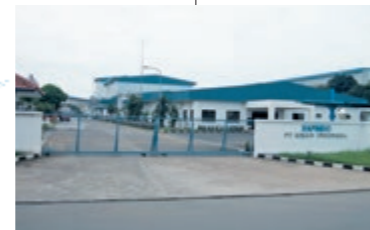
17 PT. RIKEN INDONESIA **