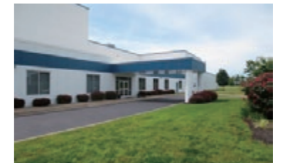
24 RIKEN AMERICAS CORPORATION