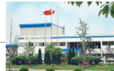
18 上海理研塑料有限公司**