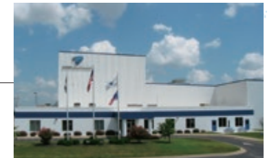
21 RIKEN ELASTOMERS CORPORATION*