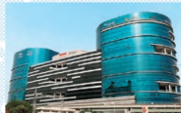
26 RIKEN TECHNOS INDIA PVT. LTD.